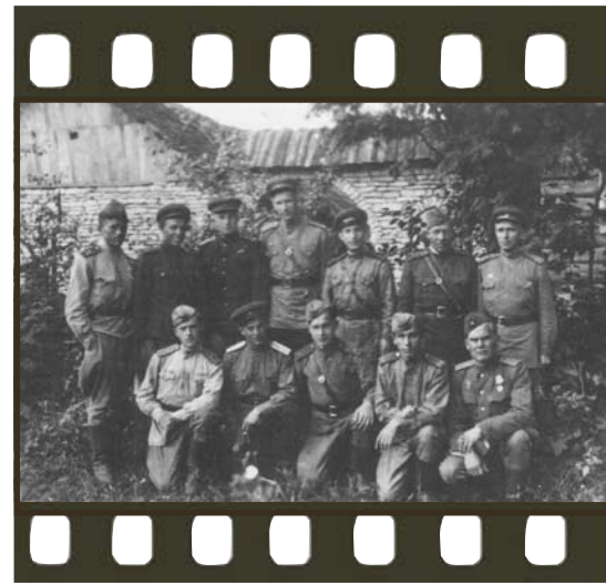
1944 год. Участники боев за освобождение Латвии