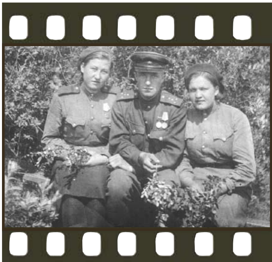
1944 год. В перерыве между боями