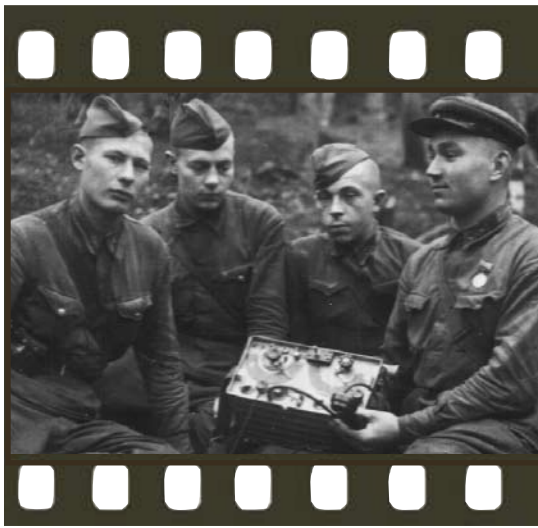
1942 год. Занятия по изучению радиостанции