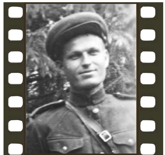
Он сражался за Родину

Кабель на восьми платформах был доставлен на берег Ладожского озера, где был соединен в одно целое и после тщательной проверки уложен на специально построенную эстакаду на барже. Началась прокладка. И в мирное-то время такая работа требует огромных усилий и большого напряжения всех участников. А в военное время – все усложняется в десятки и сотни раз. Ладога штормила, несколько дней ждали, когда более-менее погода позволит начать проведение работ. Противник старался не дать нашим войскам выполнить работу. Лишь в самом конце октября под постоянным прикрытием нашей авиации экспедиция на буксире «Буй», который тянул за собой баржу с кабелем, приступила к прокладке. В исключительно тяжелых условиях при непрерывных налетах немецкой авиации, сильном шторме кабель был проложен через Ладогу от поселка Ваганово до Белозерки всего за 8 часов. С этого момента и до снятия блокады Ленинграда в 1944 году связь с Москвой была постоянной.